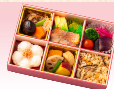
No.902 花てまり 23.6×15.8cm 税込 1,870 円 (本体価格 1,700 円)