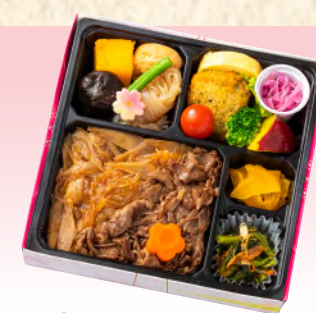
No.938 牛めし幕の内弁当 19.5×19.5cm 税込 1,540 円 (本体価格 1,400 円)