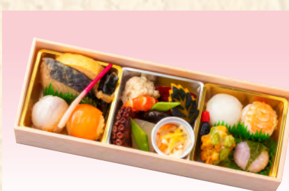
No.901 花こまち 26.5×9.5cm 税込 2,530 円 (本体価格 2,300 円)