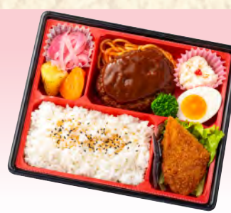
No.923 デミグラスソースハンバーグ弁当 23.0×20.0cm 税込 990 円 (本体価格 900 円)