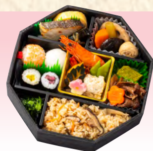
No.911 匠 20.5×20.5cm 税込 2,530 円 (本体価格 2,300 円)