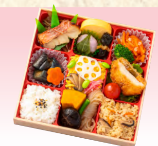
No.904 花みやび 19.5×19.5cm 税込 1,430 円 (本体価格 1,300 円)