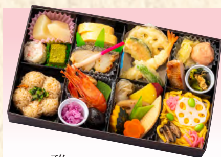
No.908 雅 28.6×17.2cm 税込 3,080 円 (本体価格 2,800 円)