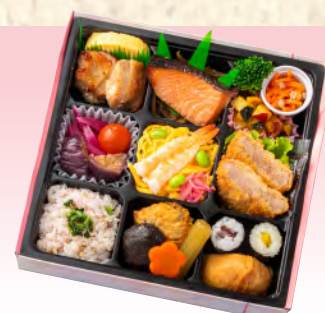
No.903 花こもん 21.4×21.4cm 税込 1,870 円 (本体価格 1,700 円)