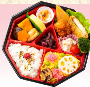
No.925 和洋ミックス弁当 20.5×20.5cm 税込 990 円 (本体価格 900 円)