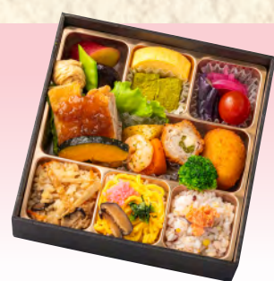
No.914 花いろは 18.3×18.3cm 税込 1,650 円 (本体価格 1,500 円)