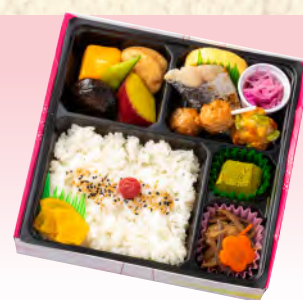
No.919 和風はなやぎ弁当 19.5×19.5cm 税込 1,210 円 (本体価格 1,100 円)