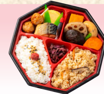
No.943 和風弁当 20.5×20.5cm 税込 935 円 (本体価格 850 円)