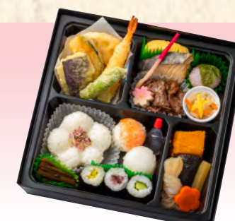
No.912 上幕の内弁当 21.6×21.6cm 税込 2,090 円 (本体価格 1,900 円)