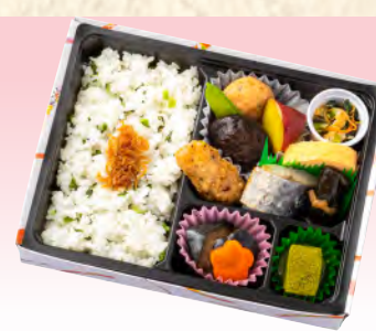
No.922 野沢菜ご飯弁当 21.6×16.5cm 税込 1,100 円 (本体価格 1,000 円)