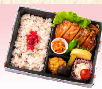
No.930 照焼チキステーキ弁当 21.6×16.5cm 税込 1,210 円 (本体価格 1,100 円)