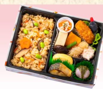
No.921 炊き込みご飯弁当 21.6×16.5cm 税込 1,100 円 (本体価格 1,000 円)