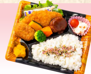
No.927 洋風弁当 23.4×19.4cm 税込 935 円 (本体価格 850 円)