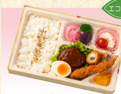
No.917 洋風幕の内弁当 27.6×18.2cm 税込 1,430 円 (本体価格 1,300 円)