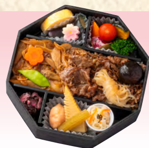
No.905 淡路牛すき焼風御膳弁当 20.5×20.5cm 税込 2,530 円 (本体価格 2,300 円)