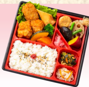
No.942 和洋バラエティ弁当 22.8×22.8cm 税込 990 円 (本体価格 900 円)