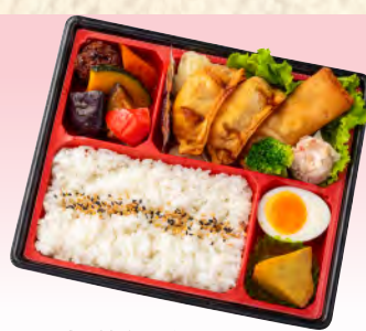
No.924 中華風弁当 23.0×20.0cm 税込 990 円 (本体価格 900 円)