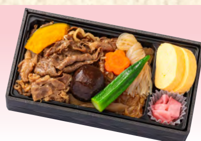
No.906 淡路牛の牛めし弁当 20.6×11.0cm 税込 1,650 円 (本体価格 1,500 円)