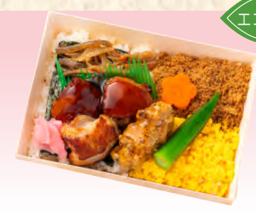
No.926 鶏づくしのつけ弁当 17.7×12.0cm 税込 990 円 (本体価格 900 円)